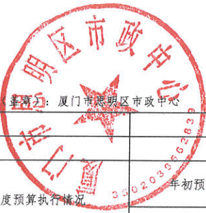
部门（单位）项目支出绩效自评表 (2023年度)