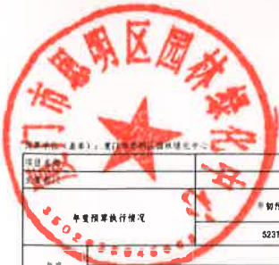
部门（单位）项目支出绩效自评表 (2023 年度)